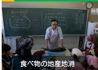
食べ物の地産地消