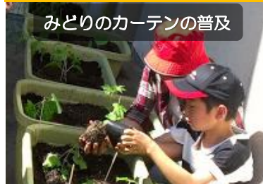
みどりのカーテンの普及