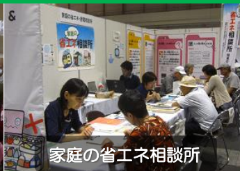
家庭の省エネ相談所