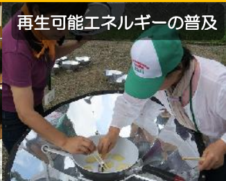
再生可能エネルギーの普及

パリ協定が発効し、世界は新たなスタートを切りました。「京都府地球温暖化防止活動推進員」は、パリ協定が目指す「脱炭素社会」の実現に向け、京都府内で地球温暖化を防止するための活動に取り組むボランティア。あなたがお持ちの特技・経験・ネットワークを活かし、活動してみませんか？例えば自治会で、学校で、地域のお祭りで、商店街で、農林水産業や製造業の現場で・・・あなたにできるアクションを起こしてください。その力が、持続可能で暮らしやすい京都府の実現につながります！