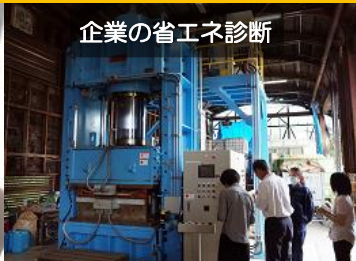
企業の省エネ診断