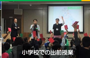
小学校での出前授業