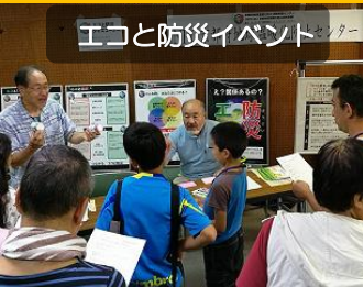
エコと防災イベント