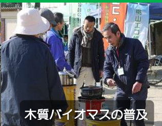
木質バイオマスの普及