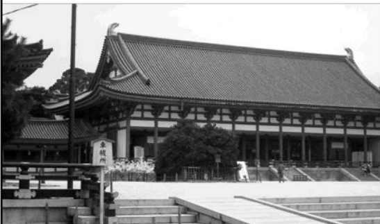
平安神宮：防災用施設の設置