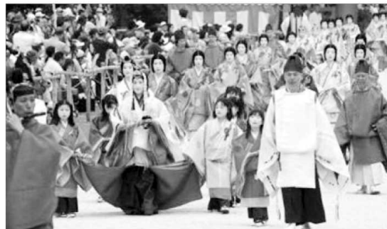
葵祭・フタバアオイオーナー及び特別観覧

寄附いただいた方には、京都ならではの 奥深い文化・文化財に親しんでいただく機会を設けます。