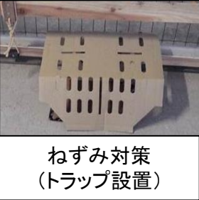
ねずみ対策 (トラップ設置)