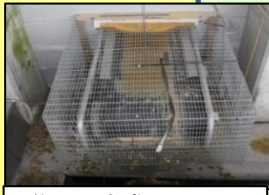
集卵・除糞ベルトの開口部の隙間対策