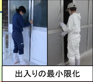
出入りの最小限化