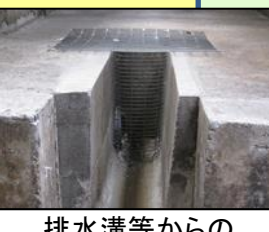
排水溝等からの侵入防止対策 (鉄格子の設置)