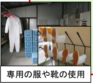
専用の服や靴の使用