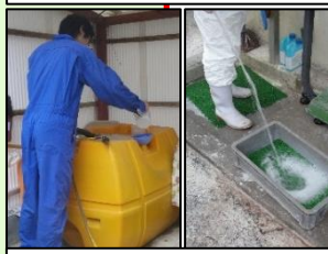
消毒液の定期的交換