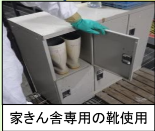
家きん舎専用の靴使用