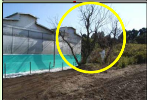
家きん舎周囲の樹木の剪定