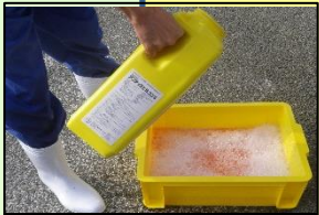
家きん舎毎の消毒