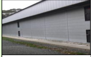
家きん舎周辺の整理・整頓