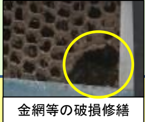
金網等の破損修繕