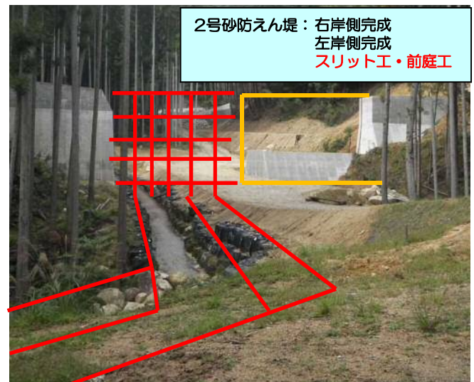
2号砂防えん堤：右岸側完成 左岸側完成 スリット工・前庭工