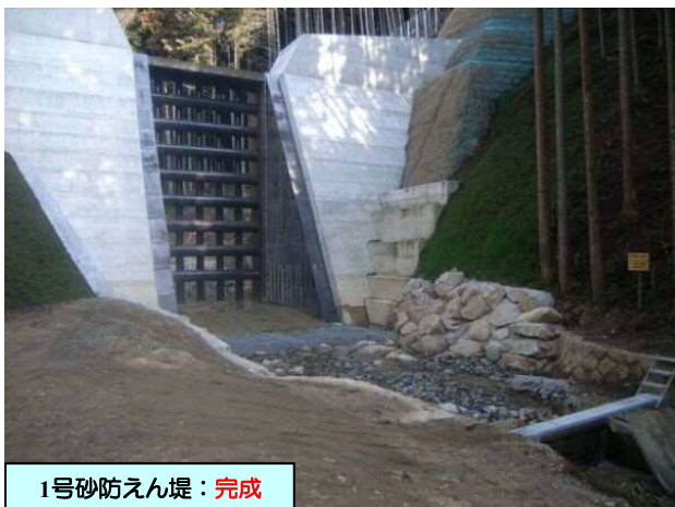
1号砂防えん堤：完成