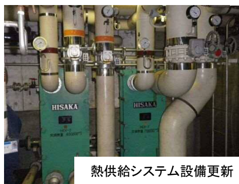
熱供給システム設備更新