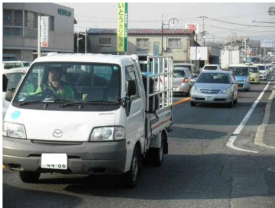
現在の状況（市街地中心部）