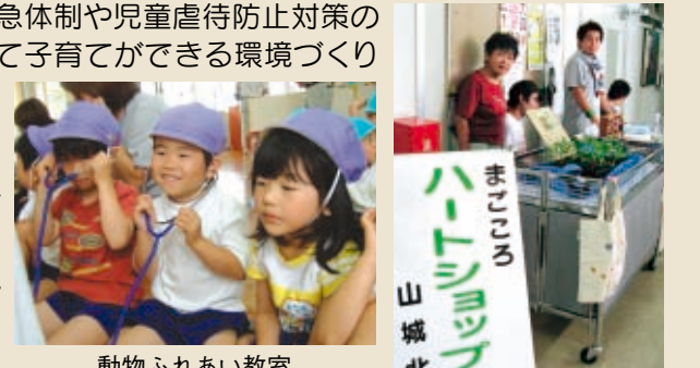
動物ふれあい教室

地域社会の子育てを支援する機能が失われているともいわれますが、一方、山城地域では、NPOなどの自主的な子育て支援の活動が芽生えつつあります。このような活動を支援して地域の健全な子育て力を再生するとともに、小児救急体制や児童虐待防止対策の充実を図り、安心して子育てができる環境づくりを進めます。また、保健・福祉・医療のネットワークをつくり、障害のある人が住み慣れた地域で自立した生活をおくれる環境づくりに取り組みます。