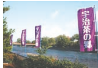
宇治茶の郷創月間