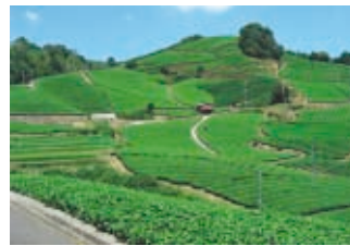
宇治茶の郷 和束の茶畑