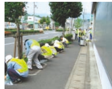
さわやかボランティアロード