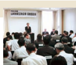
立地企業・高校懇談会

また、意欲あふれる中小企業を対象に「山城ものづくり企業オンリーワン倶楽部」の活動や、「元印中小企業認定制度」の利用を促進するなどのほか、今年度は、新たに産学公連携や企業取引の拡大のための情報発信の場として、交流フェアなどを開催します。