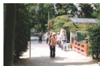
山背古道ウォーキング