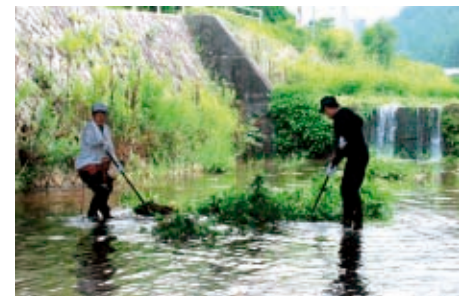
山城うるおい水辺パートナーシップ事業