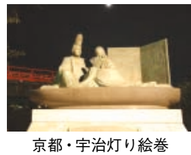
京都・宇治灯り絵巻