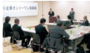
オンリーワン倶楽部活動風景

府の主要な工業地域である山城地域の、一層の発展のため、不足している企業誘致用地の確保を図るとともに、管内高校と立地企業の懇談会を開催して地元雇用への確保にも努めています。