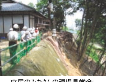
府民のみなさんの現場見学会

工事中には向日市、長岡京市の防災パトロールや府民のみなさんの現場見学会が行われるなど地域に密着した事業であり、引き続き、景観に配慮しながら着実に対策工事を進めることとしています。