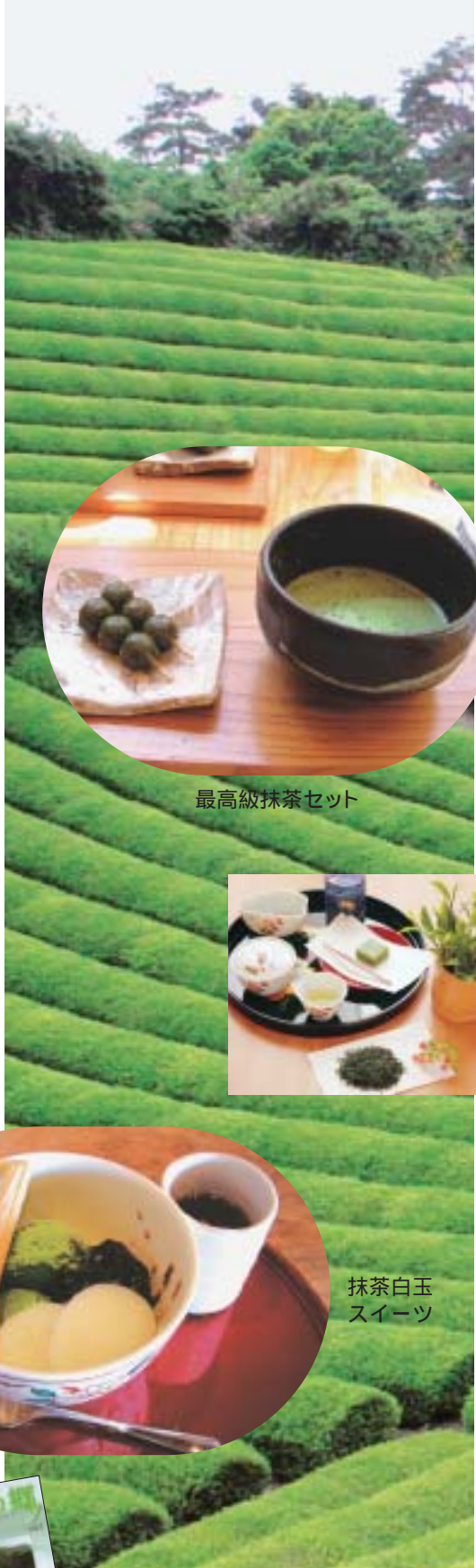
最高級抹茶セット

宇治茶を通じた和の文化の継承と「お茶する生活」の実現を目指し、山城地域では「宇治茶の郷づくり」を進めています。