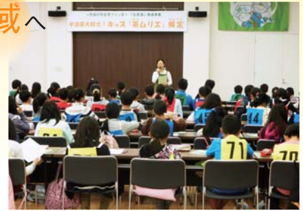
キッズ「茶ムリエ」検定会場風景

数値目標 ・ 急峻 しゅん 茶園の改修面積(延べ)：10ha ・ 荒茶生産額：77億円(平成25年度：68億円) など