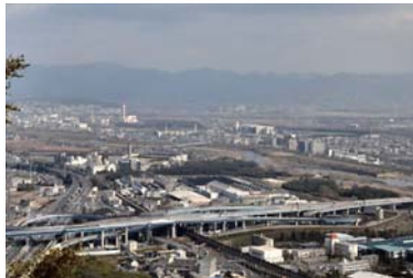
天王山(大山崎町)からの眺望