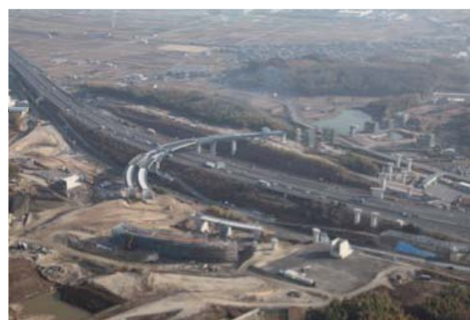
新名神・八幡JCT・IC（仮称）付近

数値目標 ・ 新名神高速道路のインターチェンジへの アクセス道路の事業進捗率：100%（平成30年度末） ・ JR奈良線の高速化・複線化関連路線の事業進捗率：100%（平成31年度末）