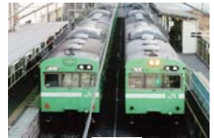
JR奈良線 (城陽市・山城青谷駅)