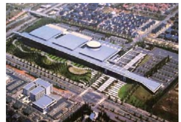
けいはんなオープンイノベーションセンター(KICK) (木津川市・精華町)