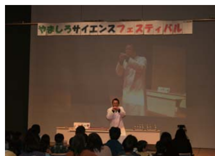
やましろのタカラ フェスティバル (サイエンスフェスティバル)

数 値 目 標 ・ 山城地域で実施される各種文化事業への参加者数：21万人(平成25年度：18万人) など