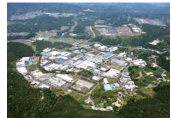
工業団地(宇治田原町)

数値目標 ・ 企業訪問活動を強化し、企業づくりサポートを実施(年間)：4,500社(平成25年度：4,099社)など