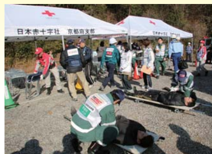
総合防災訓練（城陽市）