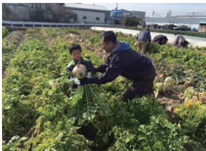
やましる「食」リレー講座 収穫体験 旬菜の里(久御山町)