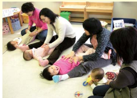
母子ふれあい広場風景 (NPO法人主催)

数 値 目 標 ・ 出生数増：500人以上(平成25年：5,482人) ・ がん検診を受診する人の割合 (胃がん、肺がん、大腸がん、乳がん、子宮がん)：50%(平成25年度：37.2%)