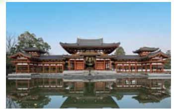
平等院鳳凰堂(宇治市)