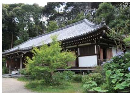
浄瑠璃寺(木津川市加茂町)