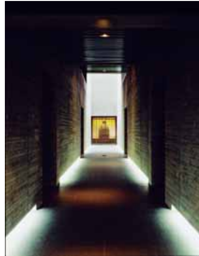
鳳翔館のエンタランス (突き当たりは「梵鐘」)