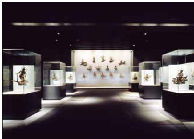
鳳翔館の「雲中供養菩薩(うんちゅうくようぼさつ)」(本文を御参照下さい)

同館には、多くの国宝を初めとする平等院所蔵の文化財が展示されており、また「デジタル・アーカイブ」を紹介する3台のパソコンにより、超高精細画像で仏像や建築物の細部まで見ることができます。