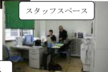
スタッフスペース