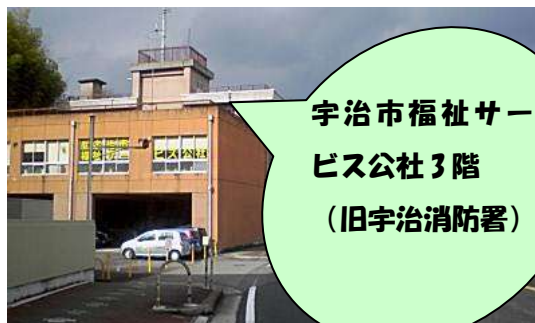
宇治市福祉サービス公社3階 （旧宇治消防署）