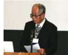
瓶原まちづくり協議会 長柄氏

「恭仁の京を生かして各世代が安心して暮らせる瓶原」と題した報告で、恭仁京朝市の取組、瓶原地区で実施している農地保全・環境美化活動、栽培した蕎麦を活用した様々なまちづくり活動を発表されました。地元製品を使った食品作りにも熱心に取り組み、各種イベントへの出展やソバ打ち教室開催など精力的に活動されています。