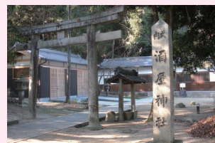
ちどりばふのきからはふ

延喜式内社。創建年月など不詳ですが、かつて神功皇后が出陣の際、神社背後の山に酒壺を3個安置して出立、帰国後その靈験に感謝して建てられたともいわれています。本殿は、一間社流造、屋根に特徴があり、千鳥破風と軒唐破風を配した神社は山城地域では珍しいものです。