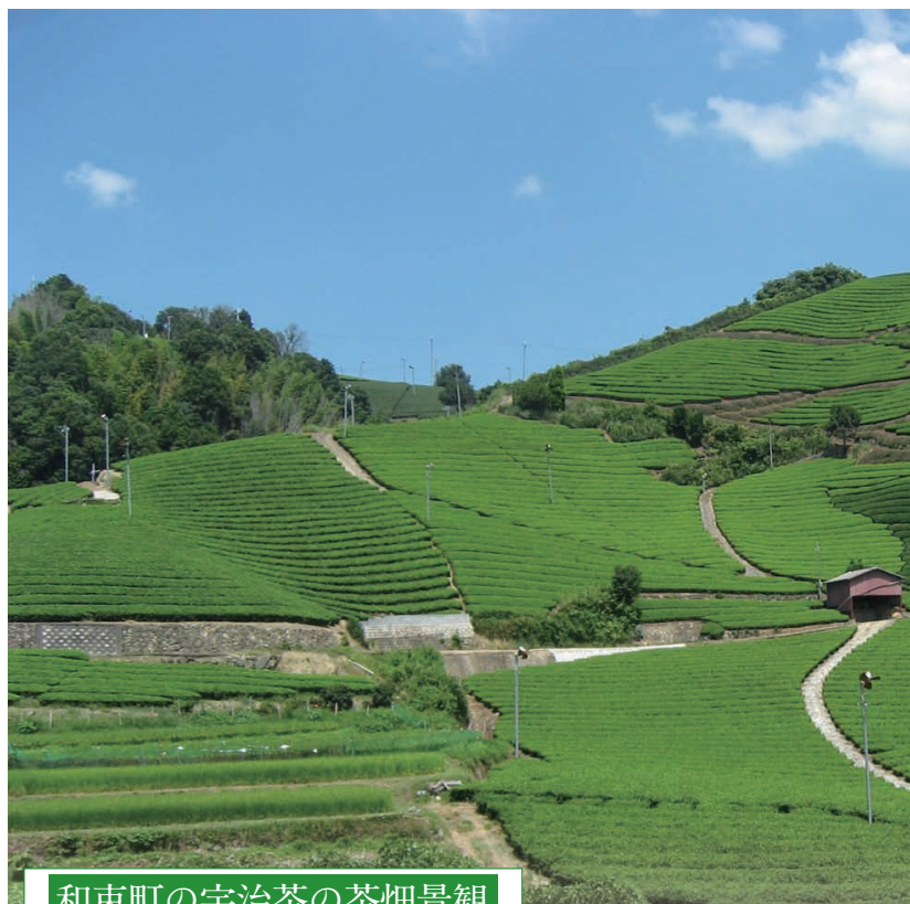
和東町の宇治茶の茶畑景観

山城地域東南部は山がちな地形で、各所に山裾から山頂近くまで、丘陵の起伏に沿って茶畑が広がっています。