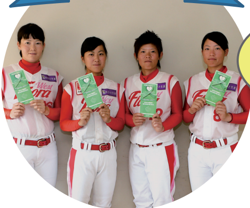
日本女子プロ野球リーグ フローラ