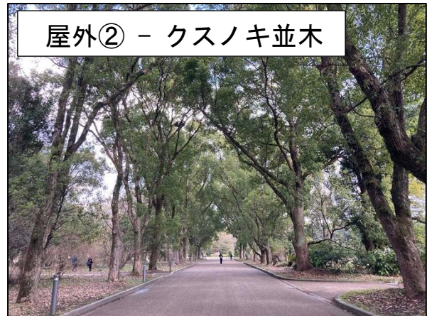
屋外② - クスノキ並木

ブースサイズ：間口約 350 cm×奥行 約 250 cm 背面板：基本的にあり（一部ない場所あり） その他環境：半透明屋根あり（日差しは強め） 人通り：多