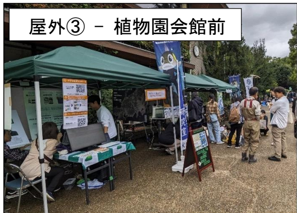
屋外③ - 植物園会館前

ブースサイズ：間口約 350 cm×奥行 約 230 cm ※希望があれば間口 500cm まで拡張可能 背面板：なし その他環境：テント(230cm×230cm)・日陰 人通り：中