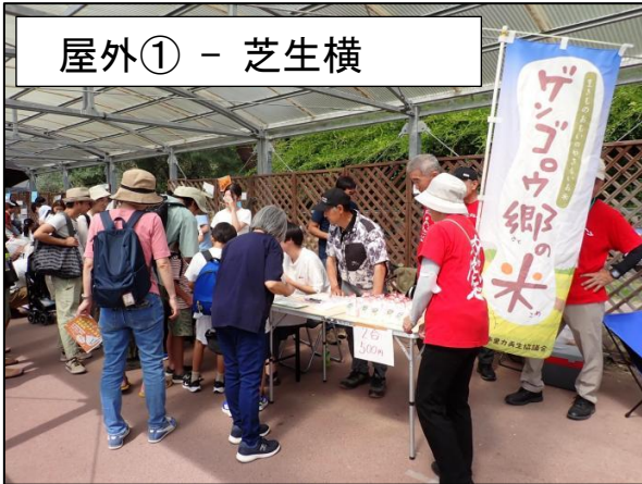
屋外① - 芝生横

ブースサイズ：間口約 350 cm×奥行 約 250 cm 背面板：基本的にあり（一部ない場所あり） その他環境：半透明屋根あり（日差しは強め） 人通り：多