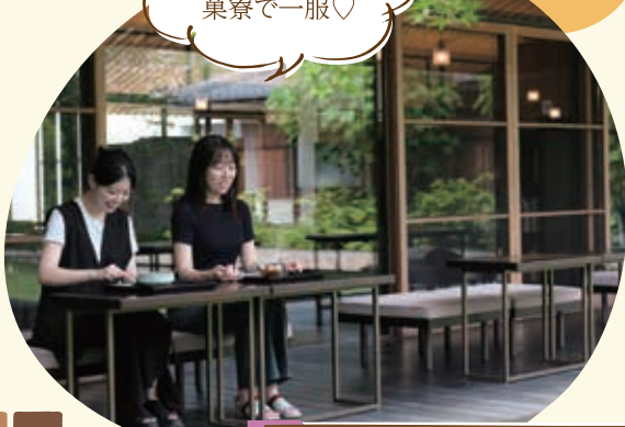
虎屋 京都ギャラリー