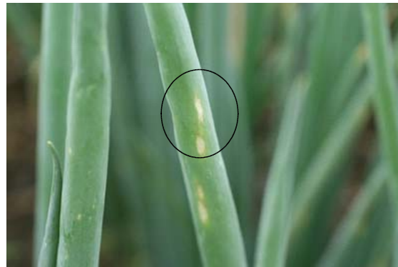
写真 ネギえそ条斑病の病徴