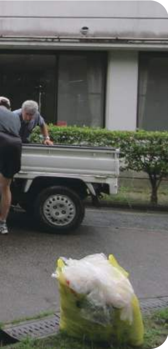
↓アルミ缶回収の様子