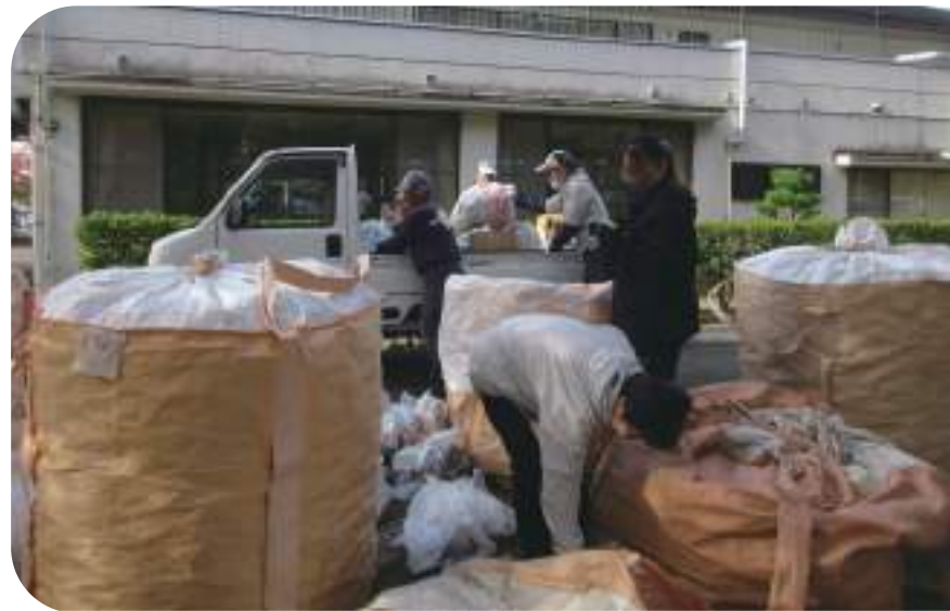
↑集まったたくさんのアルミ缶