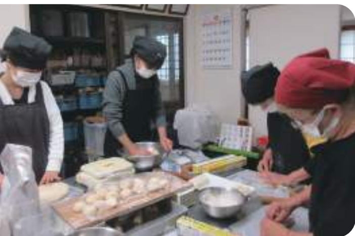
↑ 筍お焼き（かぐや姫のおやつ）作り

また竹はとても汎用性があります。筍のうちに食べることもできるし、籠や食器等の生活用具にもなります。