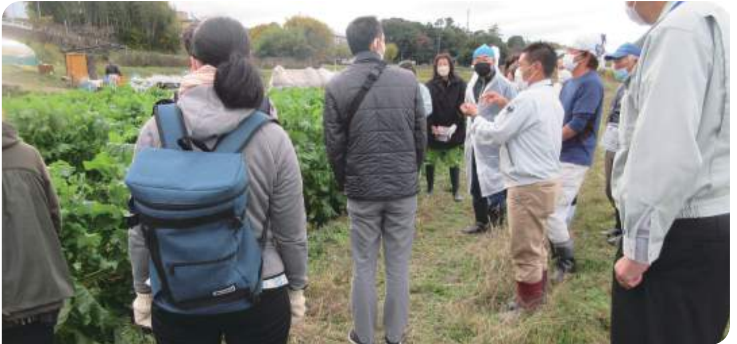
↑ 農業の現場を見学

何よりも食料自給率を上げること、安全な食べ物を自国で作っていくことが重要です。農業従事者を増やし農業を盛んにしていく必要があると加茂女は考えます。