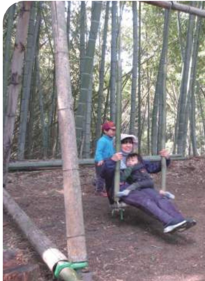
↑竹で作ったブランコ