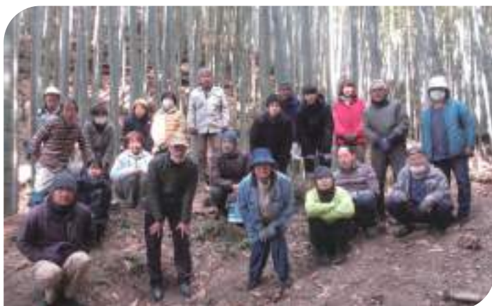
↓竹林整備の参加者たち