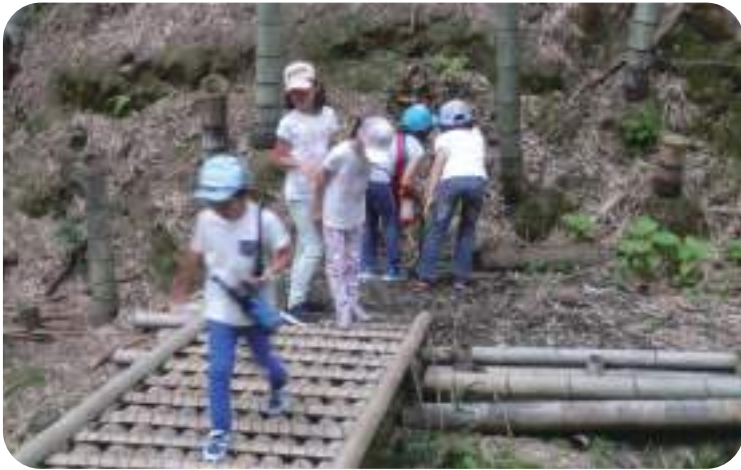
↑竹林に設置した橋