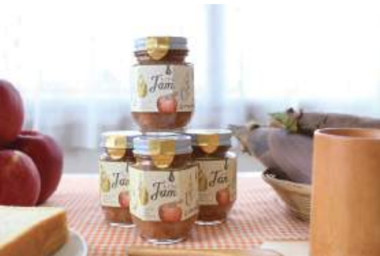
↑ 筍と林檎で作った「ちくりんジャム」