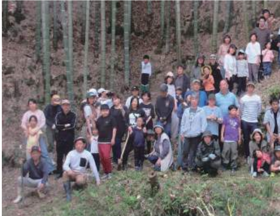
↑筍狩りに集まった参加者たち