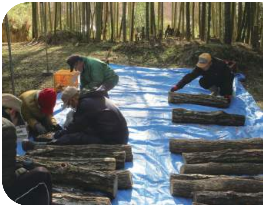
↑竹林内の環境は椎茸栽培に適しています