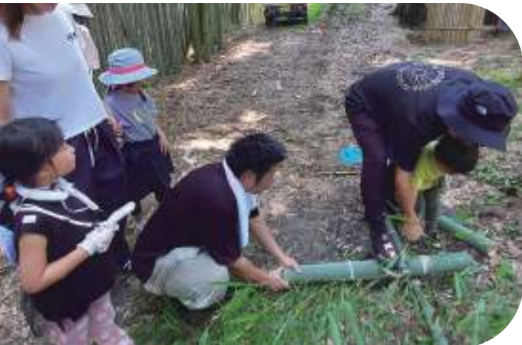
↑自分たちで流しそうめんのキットを作成