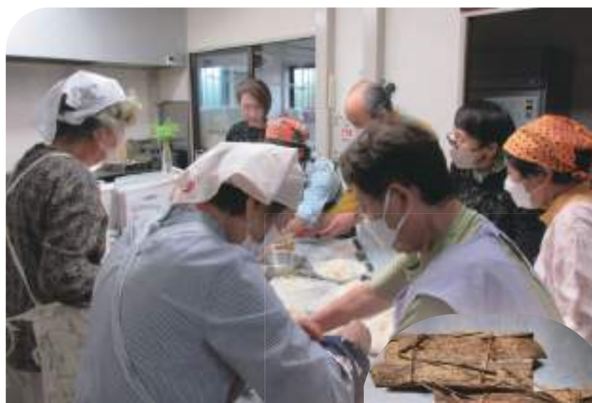
↑ 竹の皮を使って鯖寿司作り講習会