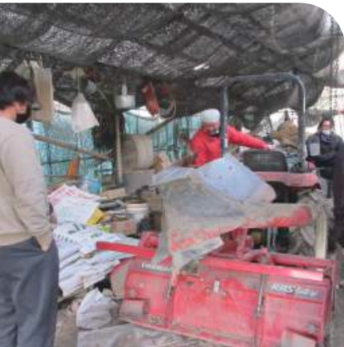
↓ 農作業に必要な機械を見学

地元の若手農業者と、移住して農家を目指す若者とのマッチングセミナーを開催しています。