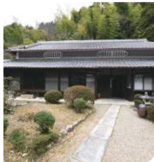
↑ 活動場所近くの古民家柳亭を購入 町興しの拠点としての活用を 現在模索中です