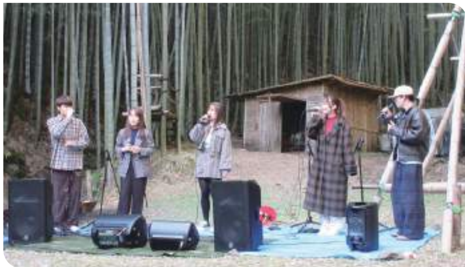
↓→竹林コンサートの出演者の方々