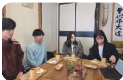
↑ 学生たちが研修に来ます