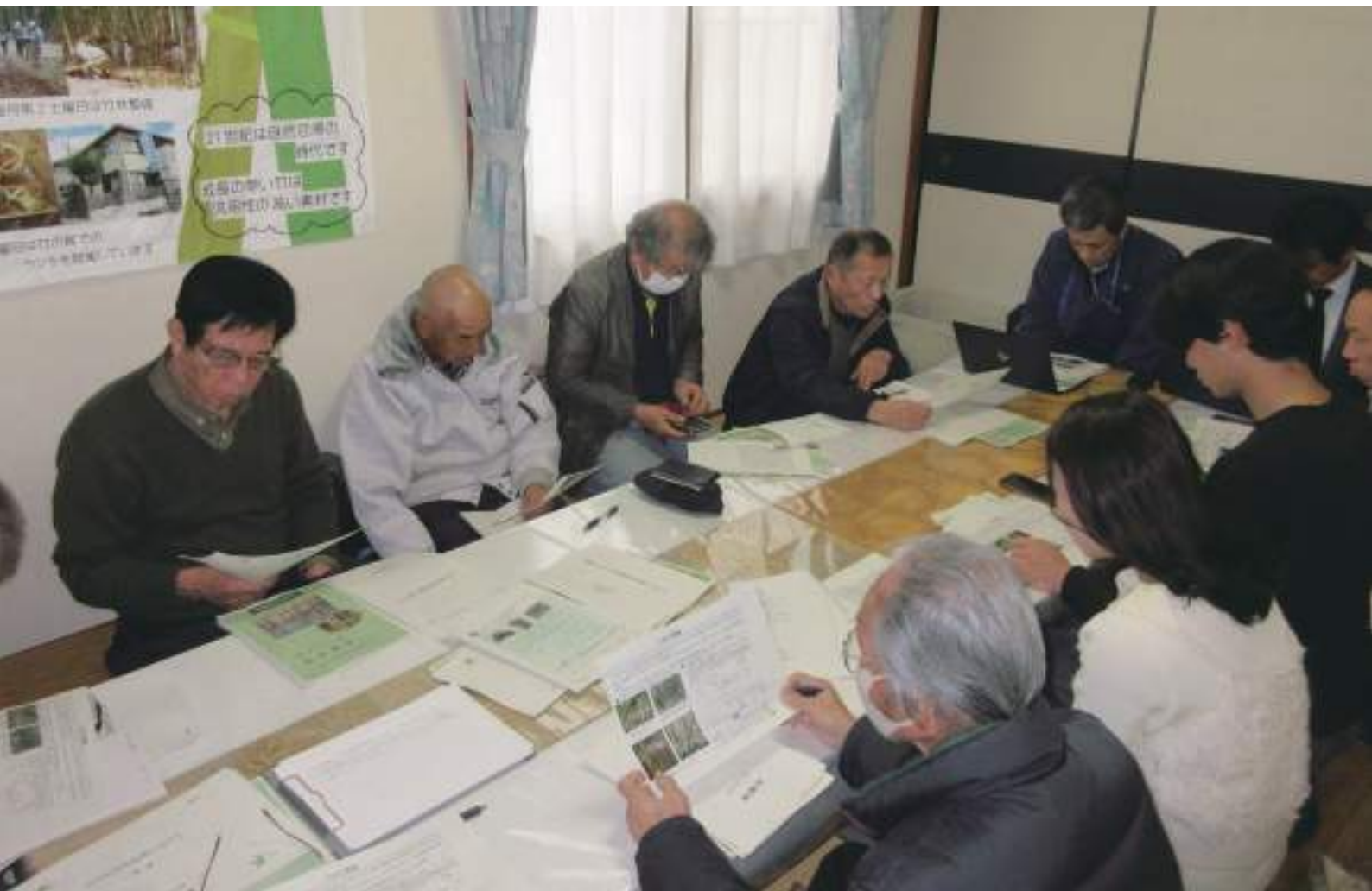
↑ 林野庁から来ていただいて有害鳥獣対策の研修会