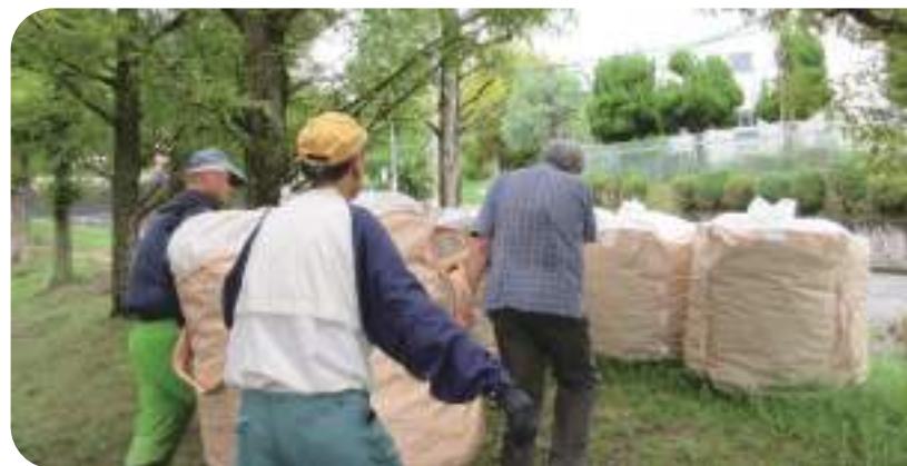
↑毎回多くのアルミ缶が集まります