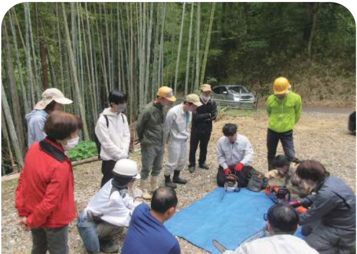
↓ チェーンソー講習会