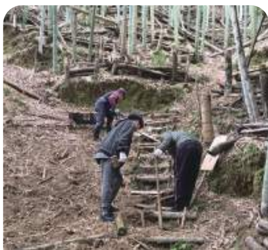
↓ 学生ボランティアによる階段作成