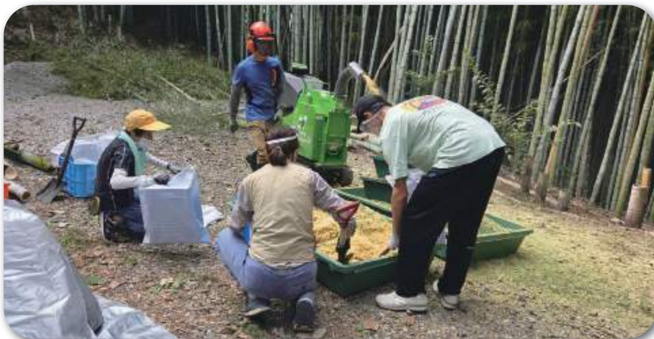
↓竹林内でチップーを作動させる