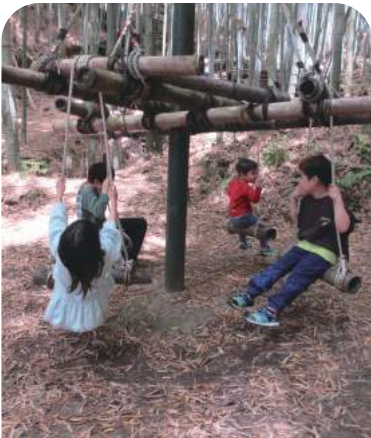
↓竹を使った遊具「回転ブランコ」