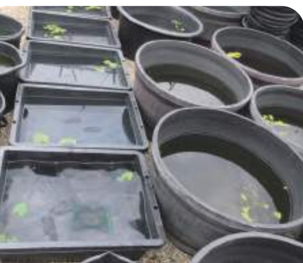
↓竹炭を観賞魚飼育用の水質浄化剤に使用