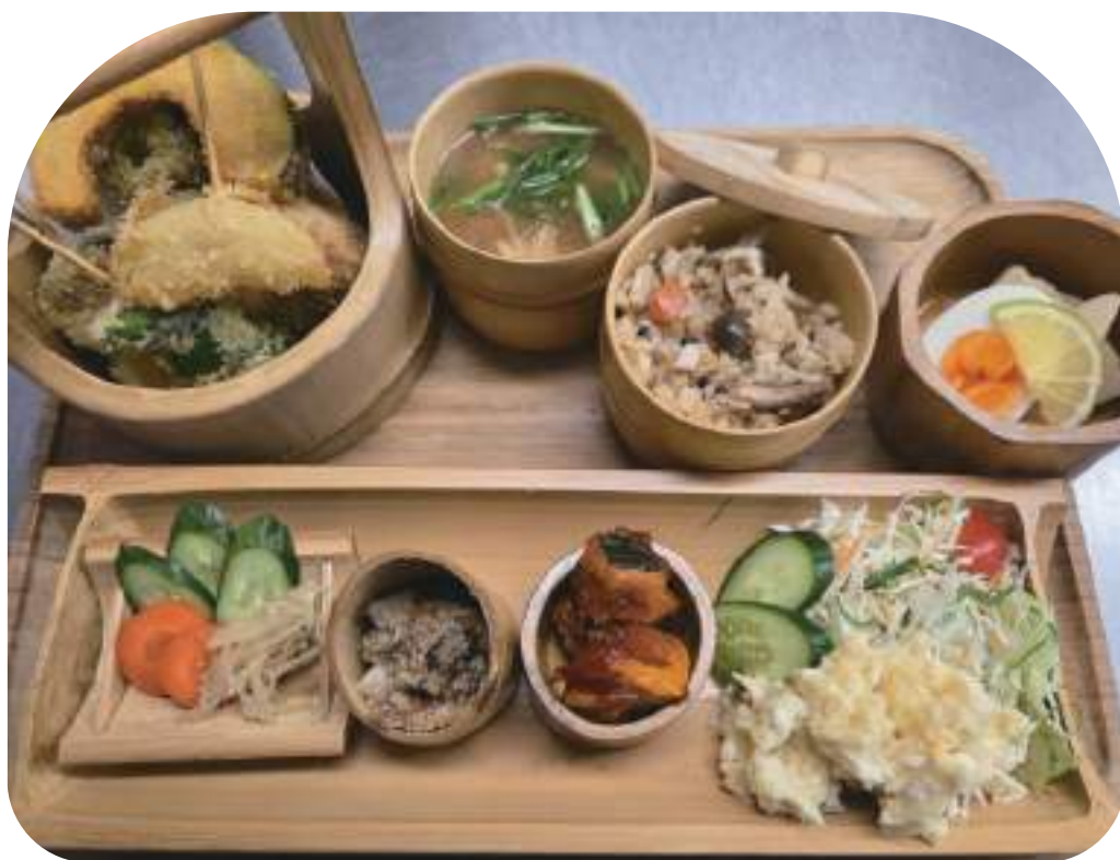
↓ 週1回かもめの台所にてランチ開催（献立は毎週かわります）

「京都のお焼きは細長い。ほそーく・ながーい、お付き合いを！」というのをキャッチフレーズにしています。