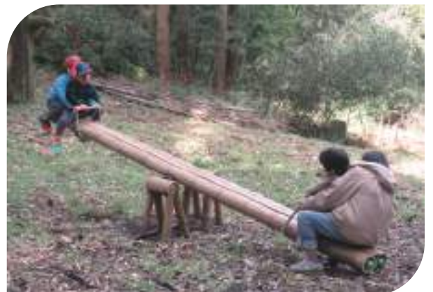
↑竹林に新たに設置したシーソー