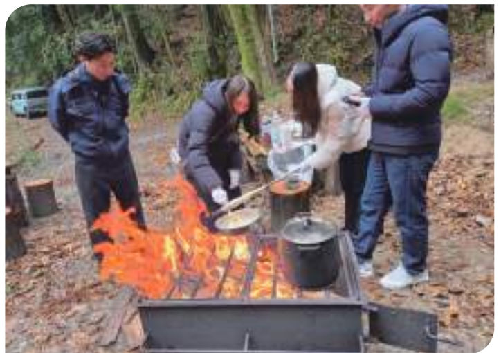
↓おいしそうなバウムクーヘンが完成！