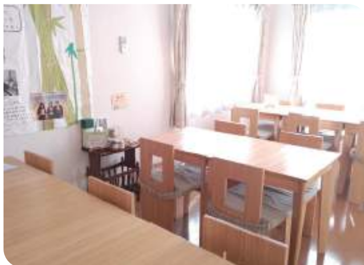
↑ かもめの台所ダイニングルーム 竹で作った机と椅子