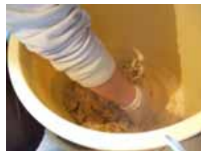
08年度 味噌作りワークショップ