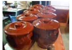
たくさんの味噌ができました