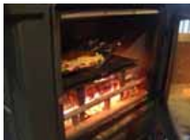
クックストーブで焼いています

ピザ一枚 2000 円(直径約30cm) (かやぶき美術館特別価格 1800 円)