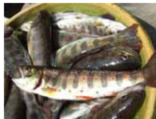
08年度 炭焼き + アマゴ釣りワークショップ