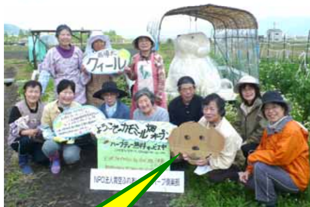
京都・かめおかハーブ畑から

田園に囲まれた、自然豊かな農園環境の中で野菜やハーブを育てたり、又収穫したり、収穫した旬の野菜を調理して、お昼御飯をみんなで食べたり楽しい時間を過ごしています。