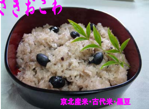
京北産米・古代米・黒豆