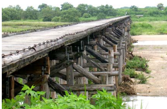
～時代劇の撮影で有名な「流れ橋」～

地元の農産資源を使った農産加工品の開発や、普及活動通して、地域の活性化と市民交流を目指しております。また、昔からの食文化の伝承にも力を入れております。