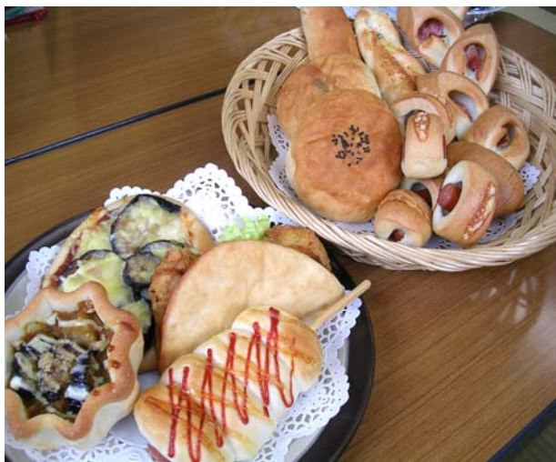
～大人気の米粉パン～