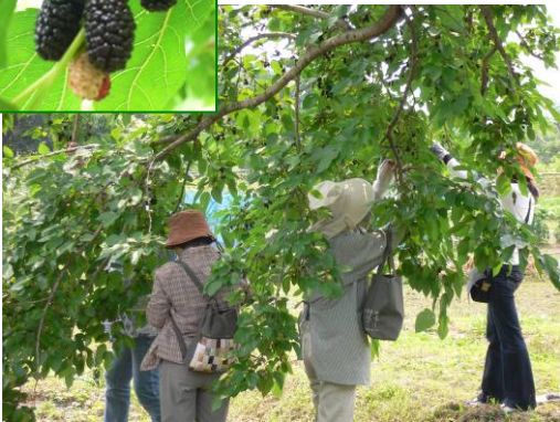
桑の実はマルベリーと呼ばれ世界中で愛されています。