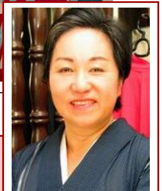
イチオシレポーター