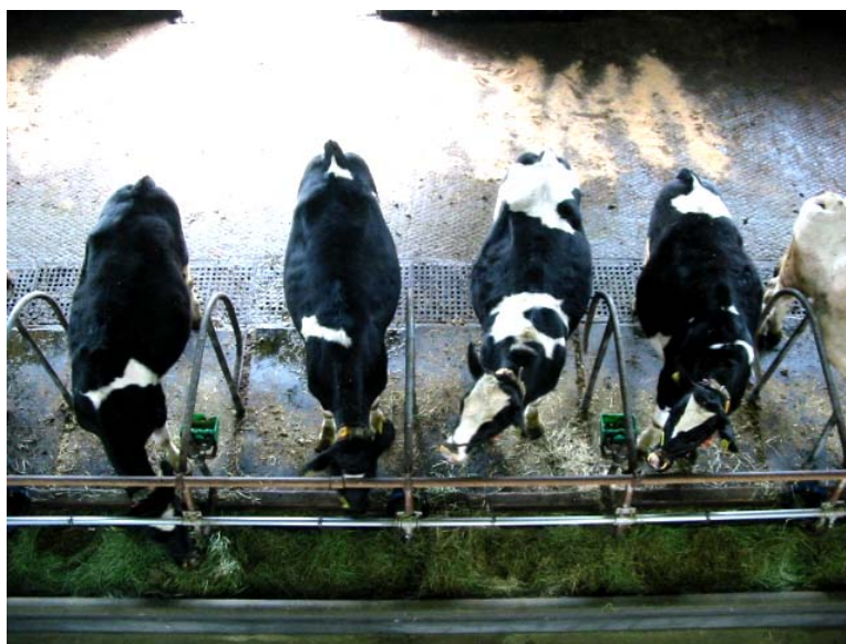
牧草をしっかり食い込んでお腹が大きく膨れた育成牛

昨年4月に農家から月齢3か月、体重110kg、体高95cm程度で導入した乳用育成素牛21頭は、当場に来て間もなく1年を迎えようとしています。春から秋にかけて緑一杯の放牧場で足腰を鍛え、冬に牛舎に戻ってからは、当場産の牧草サイレージ(発酵飼料)を腹一杯食べ、体重350kg、体高125cmの種付基準を超える良好な発育をしています。3月から和牛受精卵の移植を開始し、早期受胎に努めます。