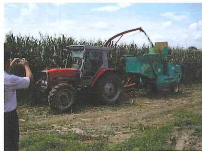
細断型ロールベラーによる刈取調製

当センターでは、細断型ロールベラーと自走ラッピングマシンを導入し、8月に飼料用とうもろこしの刈取調製を実施する予定です。