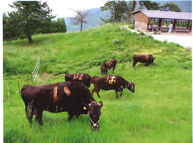
リフレッシュ牛の放牧

農家で長期間受胎していない雌牛を当場に引き取り、放牧することで、牛の繁殖機能をリフレッシュさせ、人工授精を行います。府内から3年間で26頭の牛を預かり、農家に返却しましたが、65.4%の受胎率でした。これらの牛は平均で1年以上、6回、人工授精をしても受胎しなかった牛であることから、まずまずの成績といえます。