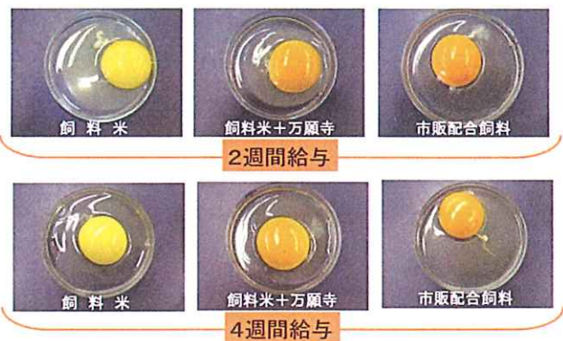
飼料米と万願寺とうがらし赤色果を組合せた飼料給与による卵黄色

【地域資源の機能性成分移行をめざした特殊卵生産技術の開発】…茶殻、万願寺とうがらし赤色果、海藻（ホンダワラ、アカモク）の粉末を飼料に添加して採卵鶏に給与したところ、鶏卵中には万願寺とうがらし赤色果に含まれるカプサンチンの移行が認められ、飼料米も含めた未利用資源の給与方法を提案しました。