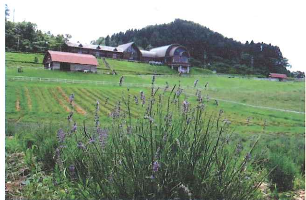
写真 開花期のラベンダー畑