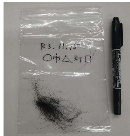
参考写真：毛の採取例