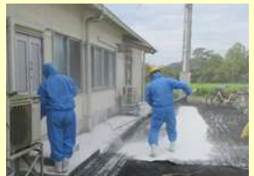
鶏舎周囲の消毒を定期的実施!