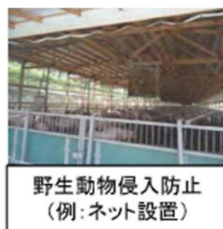
野生動物侵入防止 (例:ネット設置)