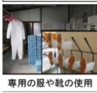
専用の服や靴の使用