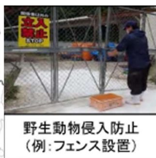
野生動物侵入防止 (例:フェンス設置)