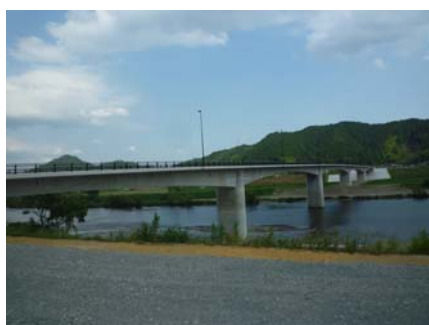
西坂蓼原線大江美河橋