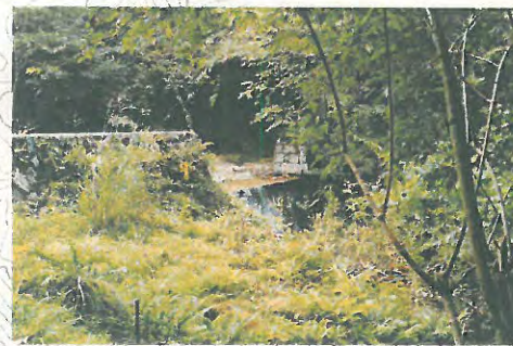
④深山川第一堰堤(雲原砂防ダム)