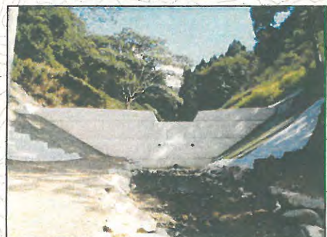
②コンクリート製治山ダム (下流側通常合板型枠)