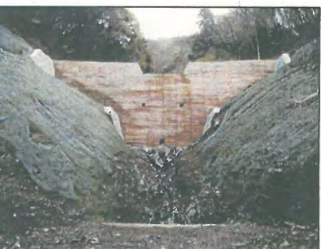
③コンクリート製治山ダム (下流側木製残存型枠)