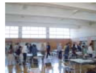
今回も多くの参加がありました

9:00 開始・あいさつ 9:15 水辺公園の使い方を考える 9:45 計画案をつくる 10:35 発表 11:10 計画案を整理 12:00 終了