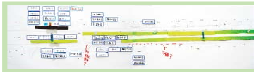
最後に各グループのアイデアをひとつにまとめました