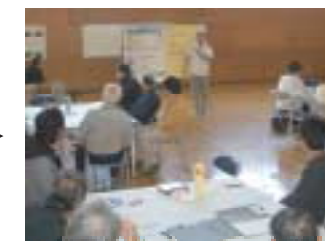
前回の結果をおさらいしました