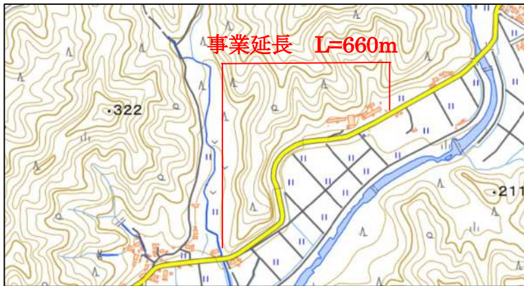
位 置 図