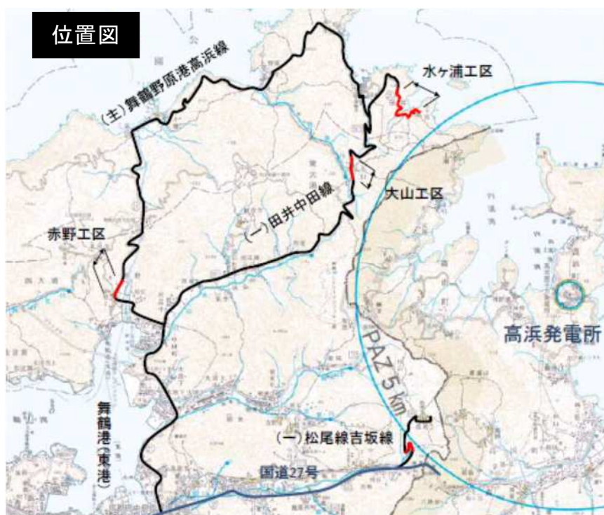
(主) 舞鶴野原港高浜線 赤野工区