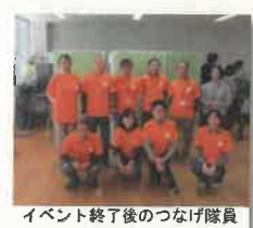
イベント終了後のつなげ隊員