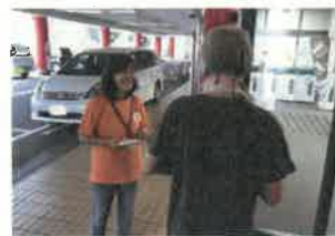
綾部市内の複合商業施設における街頭啓発の様子

認知症ラジオリレートークの4回シリーズの最終回に参加しました。認知症になっても「住み慣れたこの街で」暮らし続けられるようにとの思いを込めて放送しました。