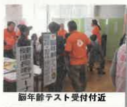
脳年齢テスト受付付近