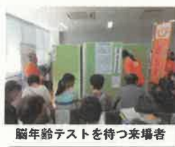
脳年齢テストを待つ来場者