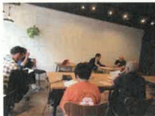
石川先生による講演の様子