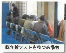
脳年齢テストを待つ来場者