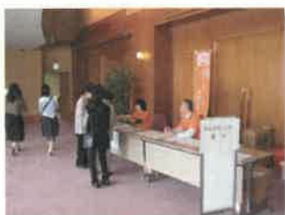
府民公開講座受付の様子

世界アルツハイマーデーの9月21日、綾部市・舞鶴市のスーパー等で啓発活動を実施しました。関心を持って聞かれる様子に心が通じるものがあると実感しました。