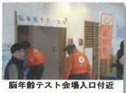
脳年齢テスト会場入口付近