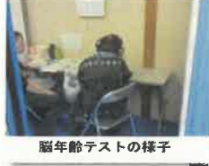
脳年齢テストの様子