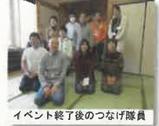
イベント終了後のつなげ隊員