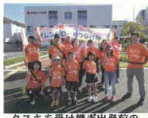
タスキを受け継ぎ出発前の記念撮影

舞鶴商工観光センターで開催された府民公開講座（映画上映会）において啓発活動を実施しました。介護経験のあるご家族のミニトークもあり、映画の内容も認知症をポジティブに捉えるものでした。