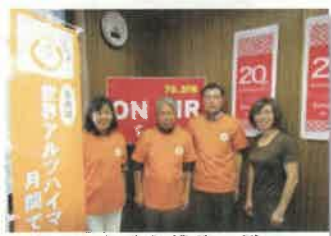
FMいかる収録後の様子

認知症リレートークの最終回に「住み慣れたこの街で」というテーマで出演しました。オレンジロードつなげ隊の紹介、活動報告、隊員それぞれの立場から感じている事を伝えました。