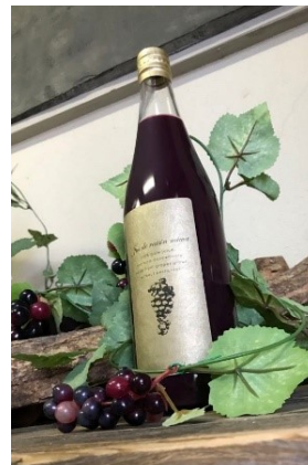
果汁100%ブドウジュース