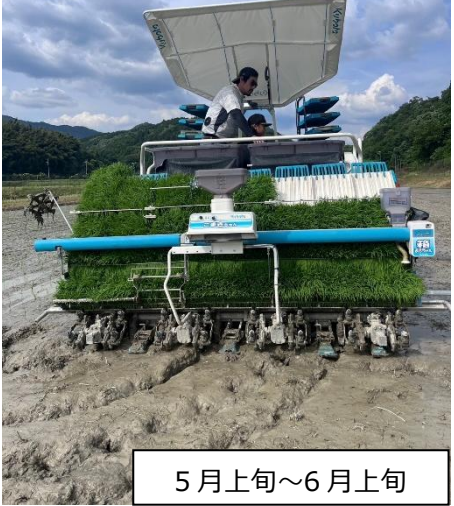
5 月上旬~6 月上旬