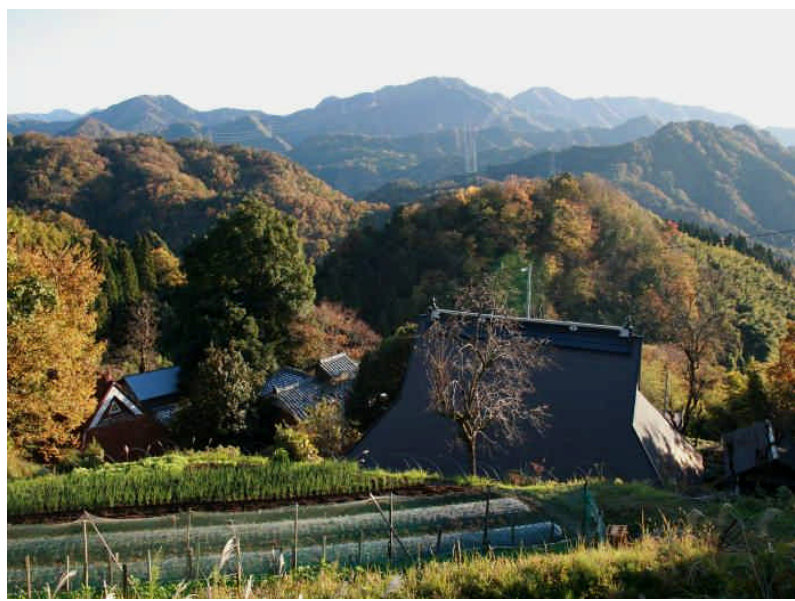
青葉山中腹の集落