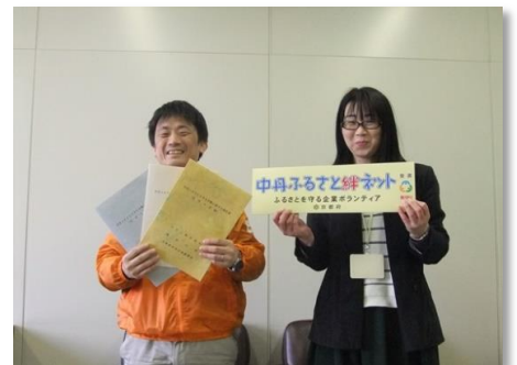
「見守り活動」協定締結：ワタミ株式会社