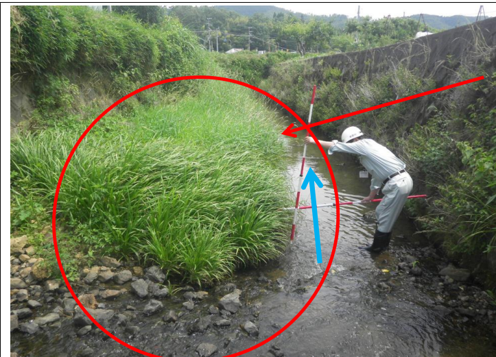
浚渫工・河床整正