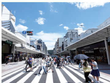
四条通歩道拡幅(京都市)