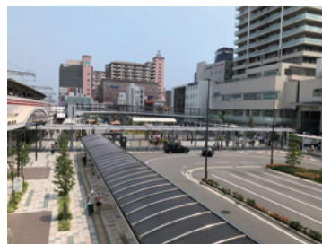
駅前広場の計画・整備(明石市)