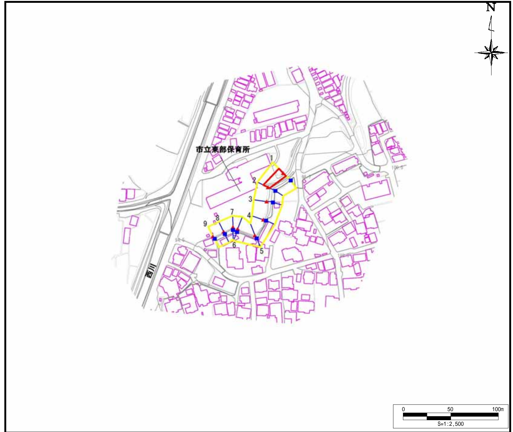
土砂災害警戒区域・土砂災害特別警戒区域 区域図