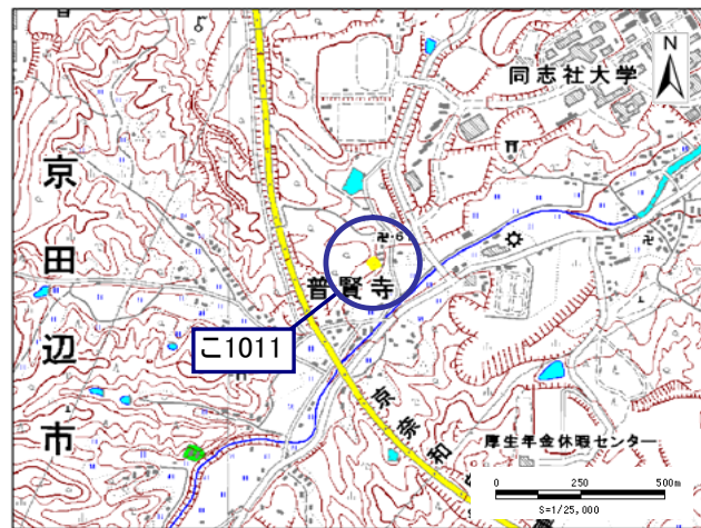
土砂災害警戒区域・土砂災害特別警戒区域 位置図

この地図は、国土地理院長の承認を得て、同院発行の数値地図25000(地図画像)を複製したものである。(承認番号 平23情復、第415号)