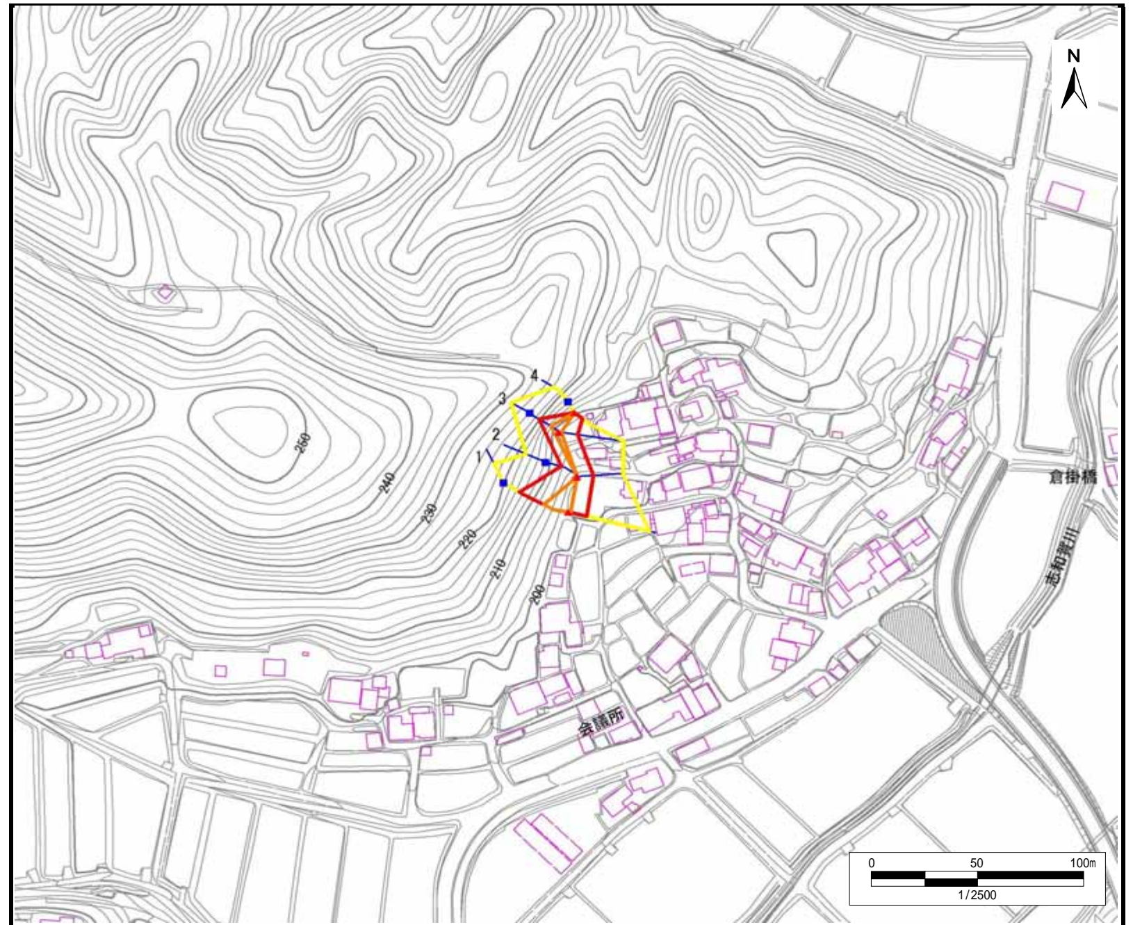
土砂災害警戒区域・土砂災害特別警戒区域 区域図