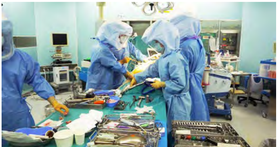
クリーンルームでの人工関節置換術

整形外科専門医は、国民に対して質の高い運動器医療を提供することが求められます。このため、整形外科専門医は、あらゆる運動器に関する科学的知識と高い社会的倫理観を備え、高い診療実践能力を有する必要があります。また、 常に探求心を持って、日々の疑問の解決に取り組み、その中から新たな知見を見出して、世の中に発信することで、医療と医学に貢献することも求められます。 さらに、コミュニケーション能力を高めて、患者だけでなく、医療関係者との信頼関係を構築することも日々の診療を円滑に行う上で非常に大切です。