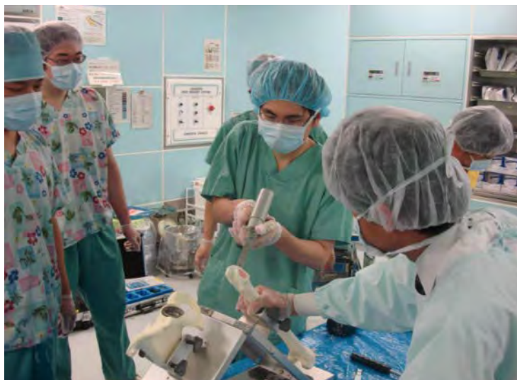
THA ハンズオンセミナー

経験すべき疾患・病態、診察・検査、手術処置等は、資料3「整形外科専門研修カリキュラム」に明示されています。手術手技は160例以上経験すること、そのうち術者としては80例以上を経験することとなっていますが、年間100例以上を目標に連携病院において主治医となって積極的に執刀していただきます。