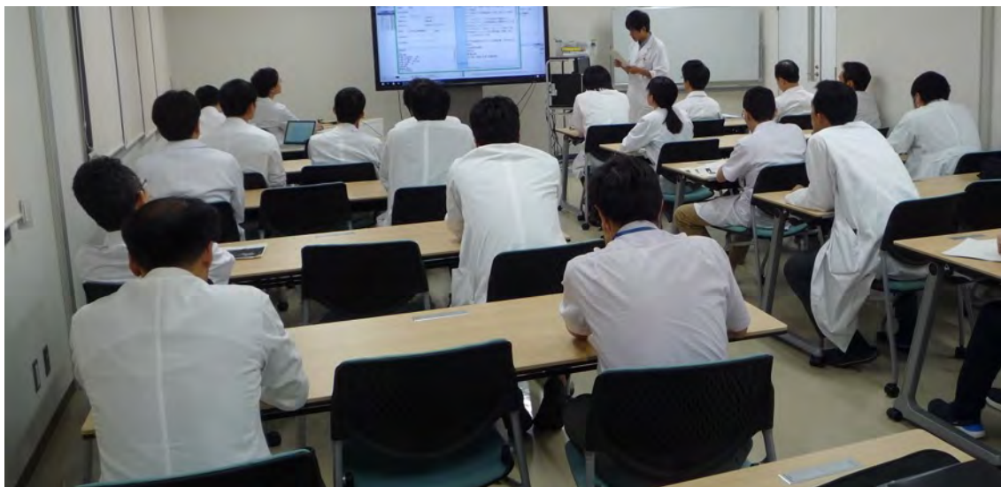
症例カンファレンス

研修プログラム終了後の進路としては、大きく分けて大学院へ進学するコースと、直接サブスペシャリティ領域の研修に進むコース、将来の開業準備などの為、 専攻医の希望する地域の関連病院で臨床経験を積み重ねるコース があります。大学院へ進学する場合、研修終了後の翌年度より整形外科に関連する大学院講座へ入学し、主に整形外科に関連する基礎研究を行います。また関連する臨床研究グループに属することにより、大学院卒業後のサブスペシャリティ領域の研修への移行を円滑に行います。 大学院在学中および卒業後に、研究を深化させるための国内外への留学も積極的にサポートします。 直接サブスペシャリティ領域に進む場合には、進みたい領域の専門診療班に所属し、京都大学整形外科ならびに連携施設において専門領域の研修を行います。また、 地域の関連病院に就職して、あらゆる整形外科疾患に対応できる総合整形外科医を目指す道も開かれています。