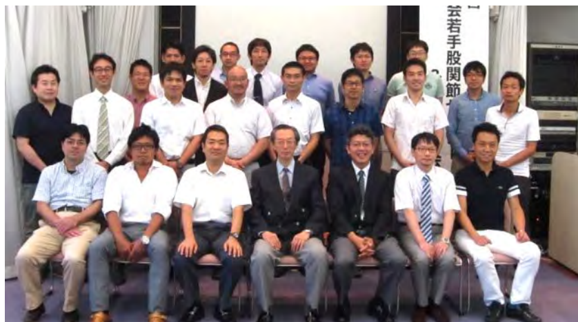
京整会若手 股関節セミナー