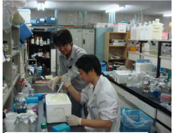
研究室での実験風景

京都大学専門研修プログラムでは、 豊富な症例数と経験豊かな指導医を有する大病院での研修と、卓越した研究基盤を有する京都大学での研修 を組み合わせ、研修終了後の大学院への進学やサブスペシャリティ領域の研修を開始する準備が整えられます。また、特例として、3年目までに十分な研修を行うことができたと判断された専攻医については、研修4年目に大学院へ入学し、大学に勤務しながら研究を開始し、1年早く学位を取得することも可能です。