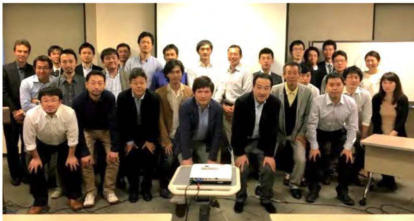
教育研修会一例：スポーツ整形に親しむ会（SPOSIN）

* 京都大学との双方向ネットワークと各連携病院間の緊密な連携、プログラム全体および地域毎の研修会での交流を通じて、全ての専攻医にレベルの高い研修を保証します。