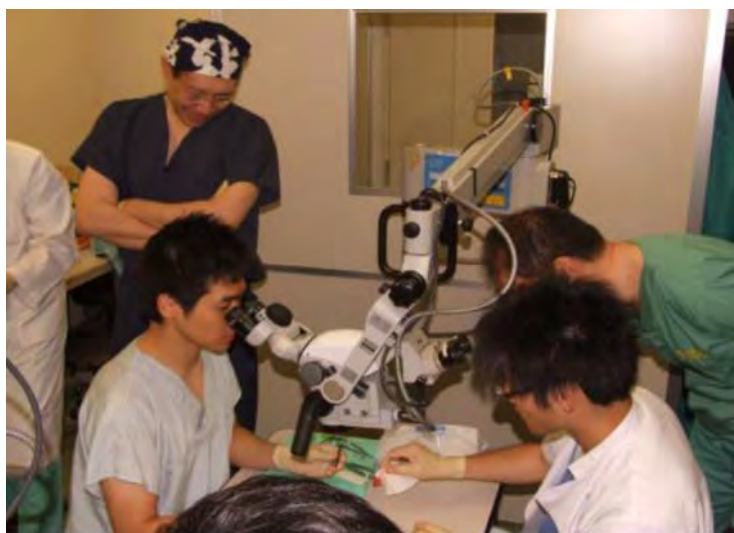
マイクロサージェリー講習会