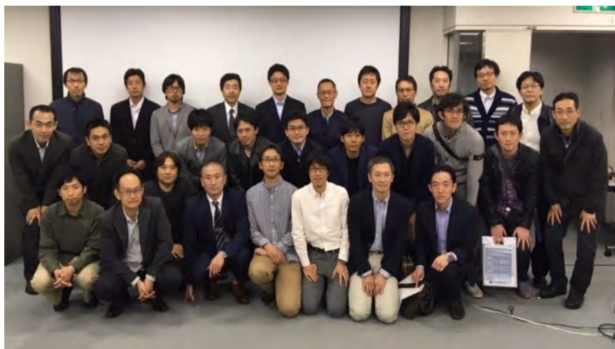
京整会若手脊椎の会

各研修施設の研修委員会の計画の下、症例検討・抄読会は全ての施設で行います。専門研修プログラム管理委員会とその所属する基幹、連携施設が企画する専攻医の知識・技能習得のための教育セミナーに併せて、症例検討会を開催し、症例経験を専攻医間で共有できるようにします。