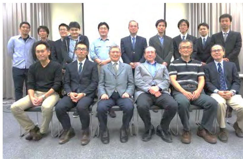
京大関連病院手外科集談会