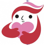
犯罪被害者等支援 シンボルマーク 「ギユつとちゃん」