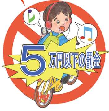
京都府道路交通規則第12条