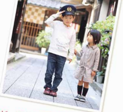
あのと、とじこめた気持ちをもういちど信じてみようと思ふ