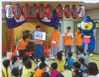
ロックモンキーズによる防犯教室