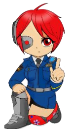
京都府警察 サイバー犯罪対策課 イメージキャラクター 才羽 京子